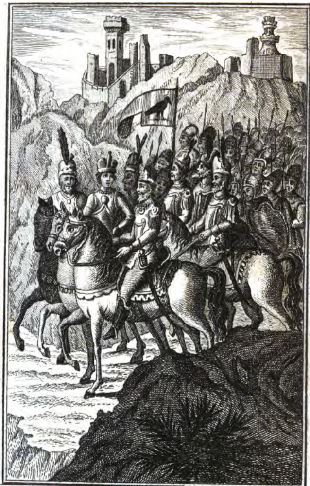
Ingressus Hungarorum. Arpado Duce.